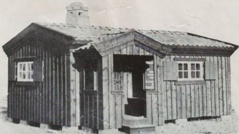
Modell N:o 2. (2 rum med vestibul och veranda).

Till skillnad från en del andra Ryggås-stugor, vilka levereras i en mångfald bräder, plank och lister, vilka köparen efter bästa