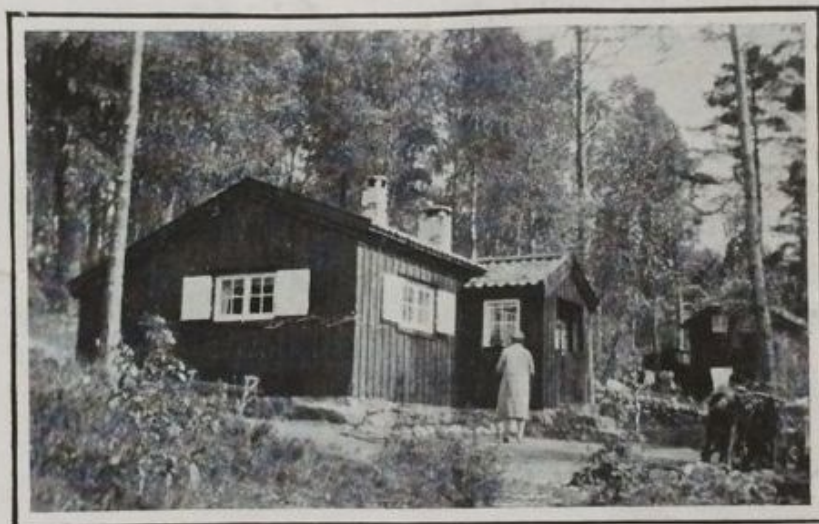
Modell N:o 3. (2 rum, kök, vestibul och veranda).

Vid uppmonteringen resas först långsidorna, efter numreringen, varefter husets gavlar inpassas i därför avsedda tappar och fastspikas. Därefter inläggs golvbjälkarna på sina respektive med nummer märkta platser och fastspikas, sedan ryggåsbjälkarna på sina tappar, därefter taket samt slutligen ås och hörnbräder.